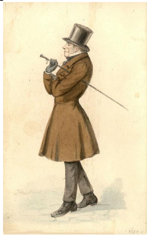
Tegnet i 1845 af Peter Klæstrup