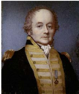
< Kaptajn William Bligh