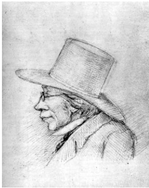
Tegnet i 1854 af H.P. Hansens