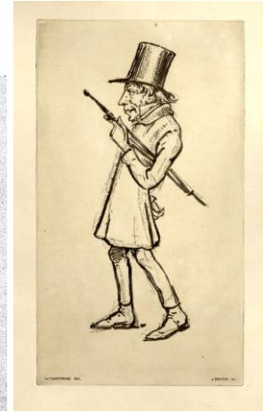
Tegnet i 1870 af Wilhelm Marstrand