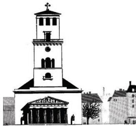
Vor Frue Kirke

Det menes at omkring 1.000 mennesker var mødt op til begravelsen, mange måtte nøjes med at strække hals uden for kirken, men det var ikke borgerskabet, nej, det var derimod samfundets