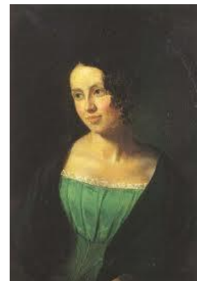
Regine Olsen >