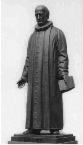
Biskop Jakob Peter Mynster

Mange år efter Sørenns skoletid blev elever fra hans klasse spurgt om, hvordan de erindrede Søren. Det blev en meget alsidig karakteristik: Stille, fremmed, glædesløs, kuet, flygtende, tilbagetrukket, sårbar, spinkel, bleg, en fremmedartet dreng fra et strengt og sært hjem. Men også drillende, vittig, næsvig, tirrende og æggende.