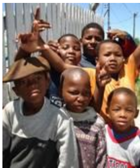
Glade børn i Langa Township

Vi er på rundtur i Langa Township, hvor der bor 180.000 mennesker. Også her er der en lokal guide, der til forskel fra tidligere vejer ¼ tons - ommomentrent. Han nænner ikke at gå forbi en stol, nej, han sætter sig på den – hver gang. På hans initiativ stopper vi ved et kulturcenter, som viser sig kun at være en salgsbod, efter min ringe mening total spild af tid. Men måske er det en hjælp til de mennesker, der arbejder i den kulturelle sags tjeneste netop i dette område.