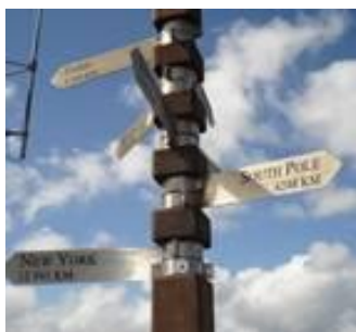
6.248 km. til Sydpolen

Og så er vi fremme ved det berømte punkt - Cape Point 238 meter over havet. Det er en lang tur med mange trapper, før vi når toppen, hvad næsten alle i gruppen gør. Men det er bestemt