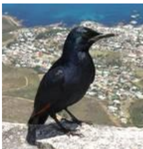
En af de mange fuglearter

Udvalget af fuglearter er enormt, ofte er arten svært at afgøre i flugten eller på grund af for stor afstand. Efter turens forskellige notater har vi set følgende: Struds, der spiser småsten for at kværne sin mad. Næsehornsfluglen, hvis livret er slanger, kaldes også flyvende banan. Hviddrygget - og hvidhovedet grib, gribbe kan flyve op til en højde af 10 km., de trækker vejret ind to gange og puster ud en gang. Vi ser et sted, hvor de har bygget reder i høje flettede elmaster. Fiskeørn, kampørn og slangeørn. Sekretærfugl, hvis vingefang kan blive 1½ meter. Gigant isfugl, perlehøns, præstekrave, kohejre, gulnæbbet stork og marabustork, der lever af fisk og affald. Et par med engelske navne er burchells coucal og forktailed drongo. Derudover mange flere som vi ikke har kunnet registrere ved navn.