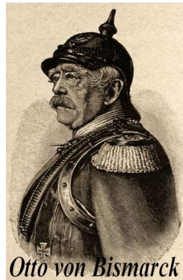
Otto von Bismarck

M en danskerne vendte det døve øre til. Monrad tog situationen roligt, både Rusland, Frankrig og England havde sympati for Danmark. Men han tog så grueligt fejl, måske den største fejlfortolkning i hele Danmarks historie. Englands Dronning Victoria var tyskvenlig, og Rusland havde ikke sympati for det danske demokrati. Den reelle støtte Danmark fik, da det brændte på, var 529 svenskere, 106 nordmænd, 7 finner og 3 islændinge alle som frivillige.