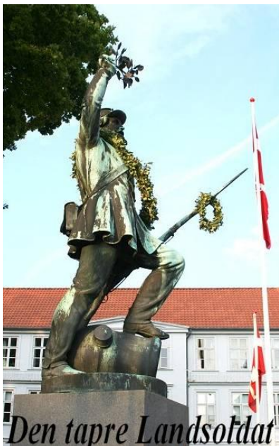
Den tapre Landsoldat

F rederik VII's tøjlesløse ungdom, to forliste ægteskaber, samlivet med den borgerlige Louise Rasmussen den senere grevinde Danner, hans manglende evne til at avle børn, hans livlige fantasi, hans lyst til at grave efter oldsager og gå på fisketure frem for at regere sit rige. Alt