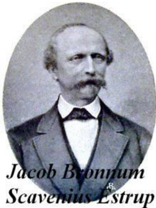
Jacob Brønnum Scavenius Estrup

Grundloven blev ændret i 1863 med den såkaldte " novemberforfatning ," der blev den direkte årsag til Anden Slesvigske Krig, fordi den indeholdt fælles forfatning for kongeriget Danmark og Slesvig. I 1866 kom en ændring af Grundloven, der nærmest gjorde Landstinget til en samling af godsejere, så den gav ikke mere demokrati. Kongen kunne stadig udpege de ministre, han ønskede. Det udnyttede Højre, fra 1875-94 sad godsejer Jacob Brønnum Scavenius Estrup (16/4 1825-24/12 1913) udnævnt af kongen som konseilspræsident uden at have parlamentarisk flertal. Estrup var en energisk og fremskridtets mand, men bestemt ikke " spiselig " for menigmand, han var modstander af grundlovsændringen, og hans synspunkt var, at almindelig valgret var " den største dårskab ," " bønder egner sig ikke til at regere ."